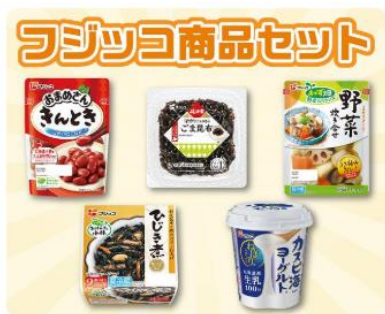
フジッコ商品セット

フジッコオリジナルグッズ、人気家電、フジッコ商品セットなどランクに応じて多彩な特典をご用意しております。