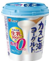
カスピ海ヨーグルト® 脂肪ゼロ 400g