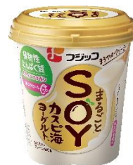
まるごとSOYカスピ海ヨーグルト® 400g