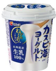
カスピ海ヨーグルト® プレーン 400g