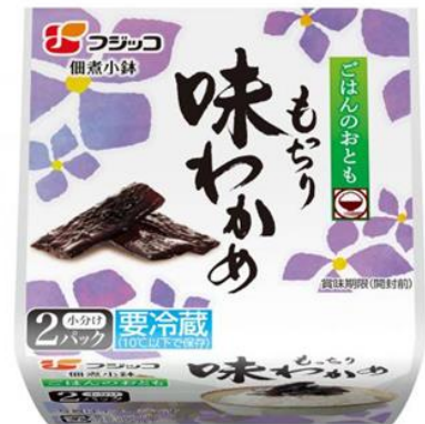
「佃煮小鉢 味わかめ 2P」