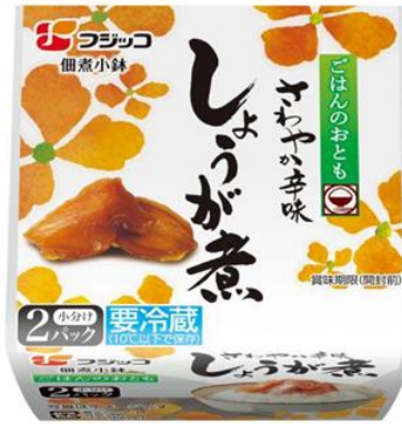
「佃煮小鉢 しょうが煮 2P」