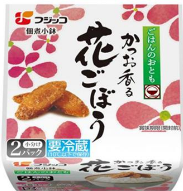
「佃煮小鉢 花ごぼう 2P」