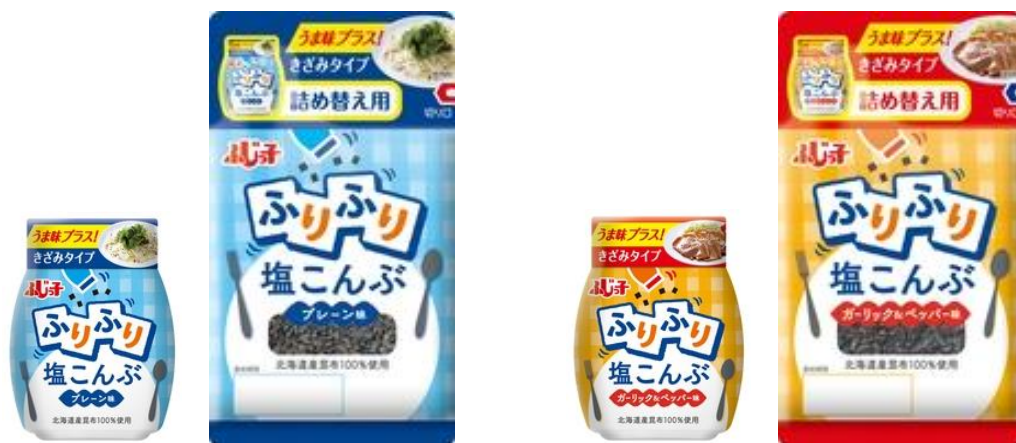
「ふりふり塩こんぶ プレーン」