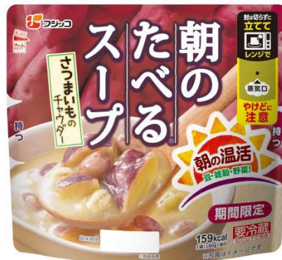
さつまいものチャウダー