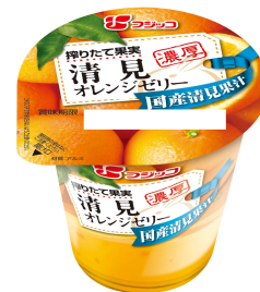
『搾りたて果実 清見オレンジゼリー』

商品画像ダウンロード: http://www.fujicco.co.jp/corp/press/dessert/shiboritate.html