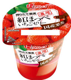
『搾りたて果実 紅ほっぺいちごゼリー』