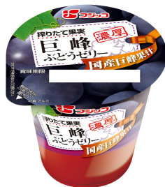
『搾りたて果実 巨峰ぶどうゼリー』