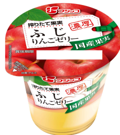
『搾りたて果実 ふじりんごゼリー』