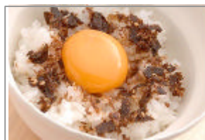
おかかっ玉ごはん