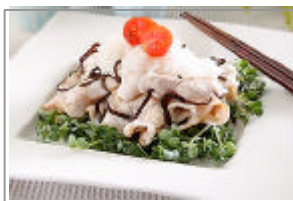
豚肉の焼きしゃぶ しそ昆布おろしがけ