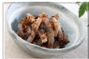
こんにゃくの おかか昆布和え