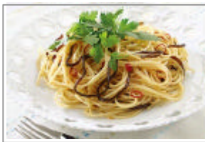
こもち昆布の ペペロンチーノ