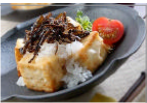
焼き豆腐の こもち昆布のせ