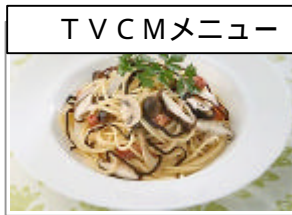
きのこの しそ昆布パスタ