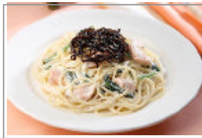
ごま昆布とサーモンの クリームパスタ