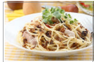
おかか昆布と 豚肉のパスタ