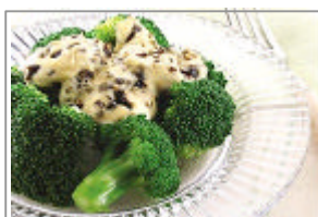
ブロッコリーの 昆布マヨソース