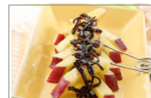
おさつ昆布バター