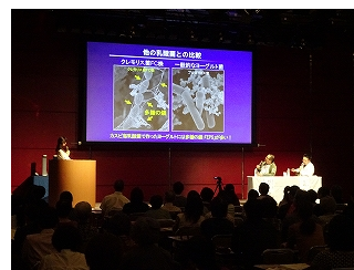
▲カスピ海乳酸菌フォーラム（愛媛）

全国各地で「カスピ海乳酸菌フォーラム」を開催し、世界屈指の長寿地域として知られるコーカサス地方がルーツの「カスピ海乳酸菌」がもつ整腸効果や免疫力アップなどの健康と長寿に役立つ働きをご紹介します。2019年は計2回開催し、907名のお客様にご参加いただき、2004年の開始以来、通算42,527名のお客様にご参加いただきました。