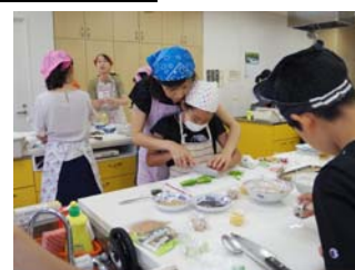
▲ヘルシー料理教室

https://www.fujicco.co.jp/know_enjoy/healthycook/