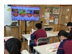
採用校の授業の様子