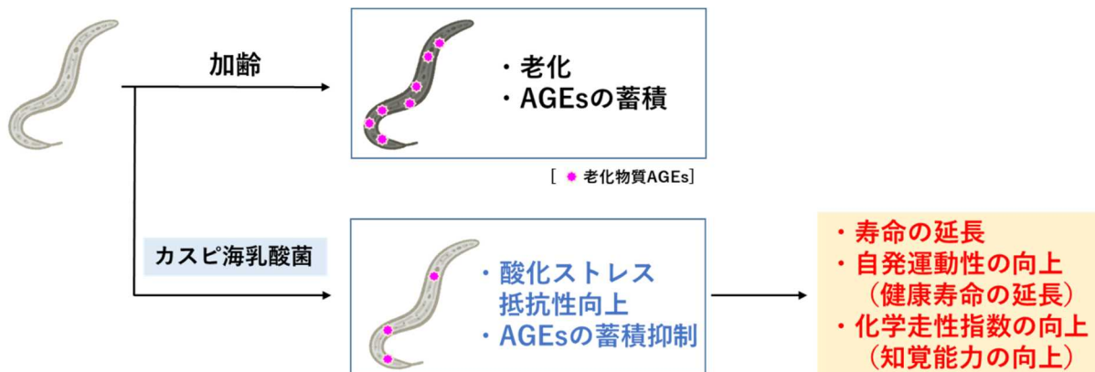
図 2. 「カスピ海乳酸菌」による線虫の寿命延長メカニズム