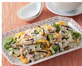
「ふじっ子入り レタス炒飯」