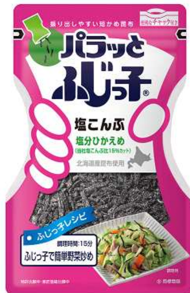
「パラッとふじっ子」

＜商品画像ダウンロード： http://www.fujikko.co.jp/corp/press/fujikko/paratto.html