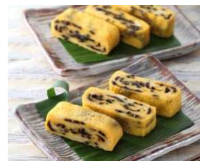
「ふじっ子入り 卵焼き」