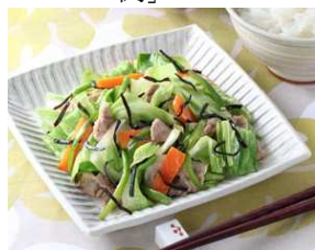
「ふじっ子入り 野菜炒め」