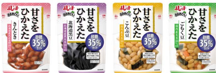
『甘さをひかえたおまめさん』シリーズ

商品画像ダウンロード http://www.fujicco.co.jp/corp/press/low sugerbeans/