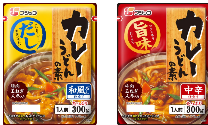
「カレーうどんの素 和風だし」 「カレーうどんの素 中辛」