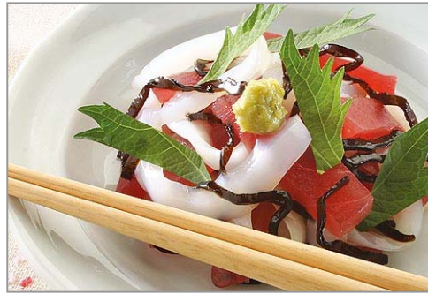
【刺身のしそ昆布和え】