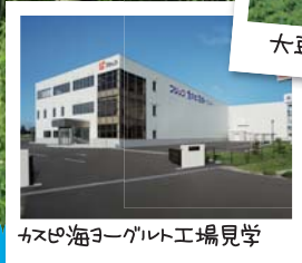
カスピ海ヨーグルト工場見学